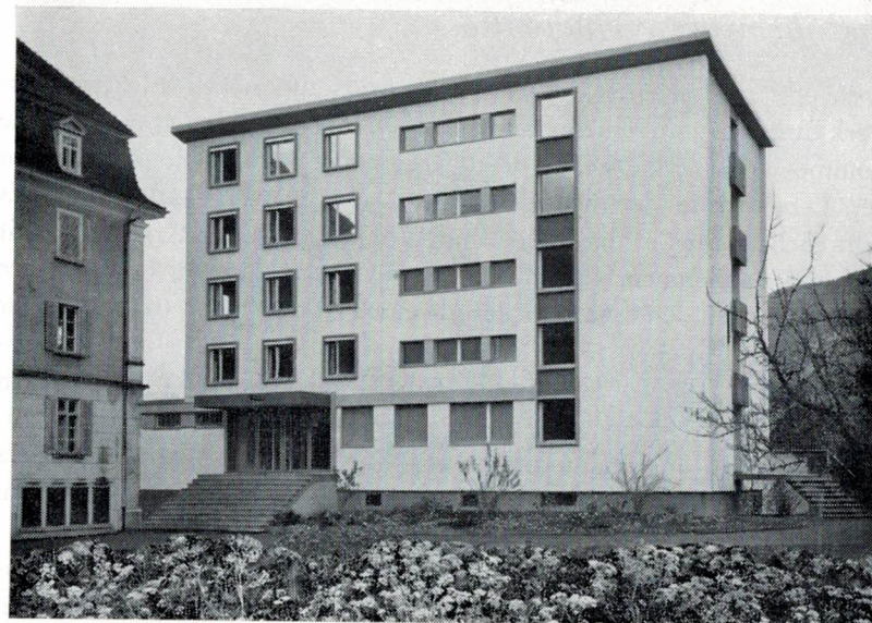
Der Neubau von Nordosten

Alle wollen wir einmal etwas zurückdenken und uns einen Moment auf dieses stille Wirken der Schwestern besinnen. Sie ver-